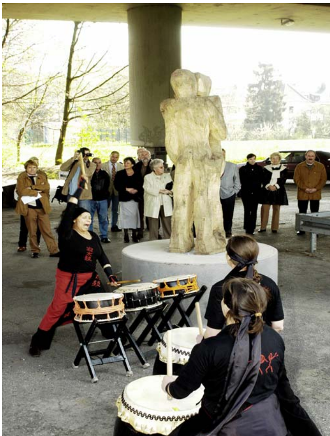
Die Gruppe „Shakty“ während der Übergabe der Skulpturen. Im Bild das Werk von Roger Löcherbach: „Paar“

Am 20.04.2006 wurden die zwischenzeitlich aufgestellten Kunstwerke unter großer öffentlicher Beteiligung offiziell übergeben.