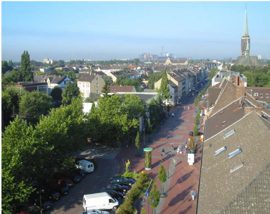
Von-der-Mark-Straße aus Richtung Bezirksamt

Auf die Wiederholung grundsätzlicher Ausführungen z.B. zur Geschichte der Bezirksämter wird hierbei wie im vergangenen Jahr bewusst verzichtet.